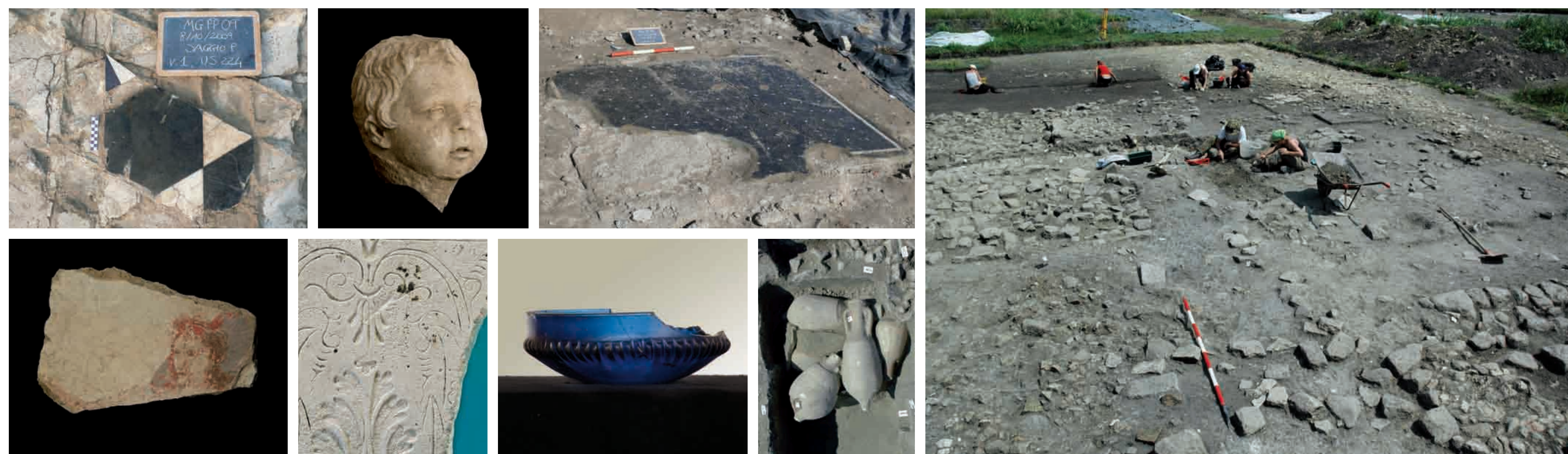
Fasi di scavo dell'edificio medievale Ausgrabungsarbeiten des mittelalterlichen Gebäudes Excavations at the medieval building